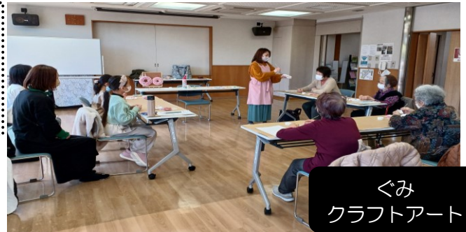
ぐみ クラフトアート