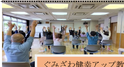
ぐみさわ健幸アップ教室