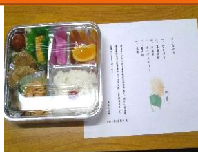
作りたての手作りお弁当!