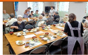
皆さんでの食事会も少しずつ再開!