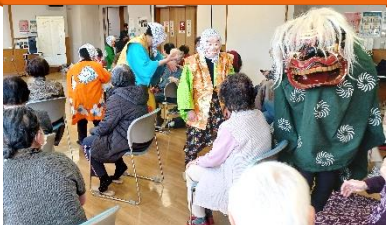
楽しみな催しもの