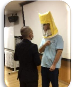
職員のマスクのフィットテスト中

神奈川県看護協会の感染管理認定看護師の方をお招きし、施設内を見回りアドバイスをいただきました。講義では有効的なマスクの装着の仕方を再確認しました。