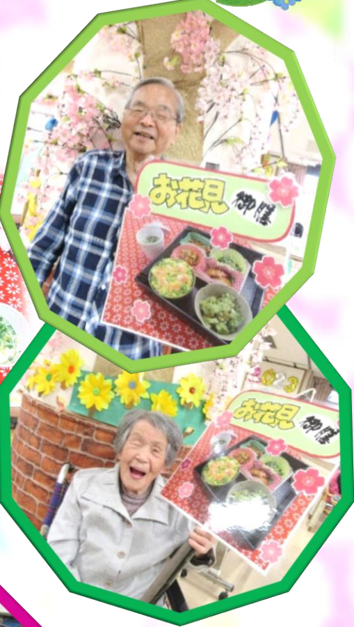
美味しい食事で 皆様笑顔に♪