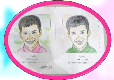
似顔絵のポランチアさん始めました♪ 皆様もご一緒にいかがですか？