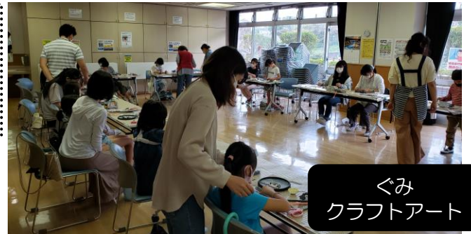
ぐみクラフトアート