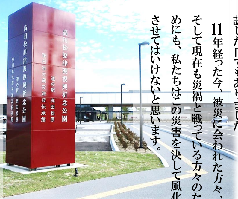
写真：東日本大震災津波伝承館 「いゆて TSUNAMI メモリアル」<陸前高田市>

11年経った今、被災に会われた方々、そして現在も災禍と戦っている方々のためにも、私たちはこの災害を決して風化させてはいけないと思います。