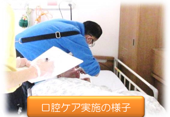
口腔ケア実施の様子

しらゆり園では、毎週、歯科医師に来て頂いています。現在は主に歯科治療、口腔衛生に関わって頂いています。口腔衛生は、歯科医師、介護職員、管理栄養士が立ち合い、まずご利用者の歯の本数・義歯の不具合・虫歯・かみ合わせ・歯周病などの炎症状態をみていただきます。次に口中の衛生状態、磨き残しなどをみていただきます。その結果、歯磨きを自分で行えている方には、どこに磨き残しがあるかポイントをお伝えし毎日の歯磨きに役立てていきます。