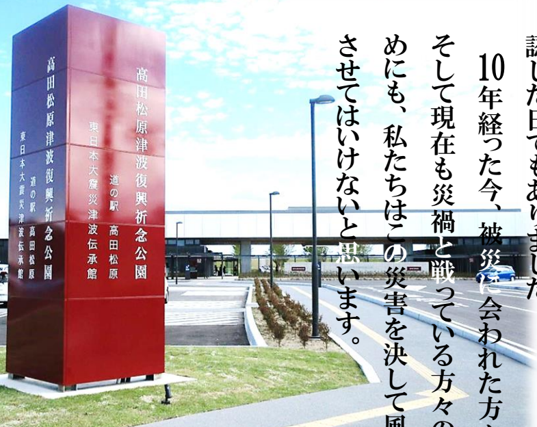
写真：東日本大震災津波伝承館 「いわて TSUNAMI メモリアル」<陸前高田市>

10年経った今、被災者や会われた方々、そして現在も災禍と戦っている方々のためにも、私たちはこの災害を決して風化させてはいけないと思います。