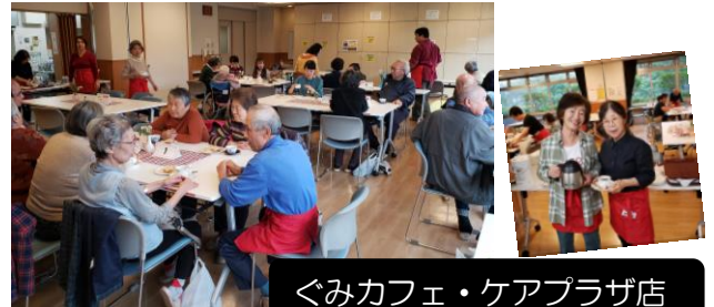
ぐみカフェ・ケアプラザ店

平成31年度は“地域のだれでもが参加できる”ことをテーマにした2事業を地域の皆さんと一緒にスタートさせました。「ぐみカフェ」では毎月大勢の方にご来店いただき、「ぐみクラフト」ではかわいいもの作りを通して小さな多世代交流の場を持つことができました。