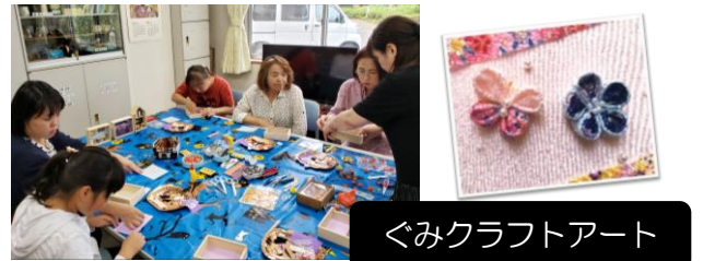
ぐみクラフトアート