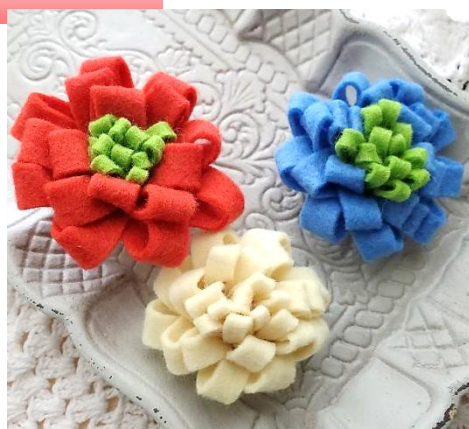
★カラー写真はHPでご覧いただけます

色が豊富でほつれたりせず 扱いやすいフェルトで コサージュを作りましょう。 はさみの入れ方次第でお花の バリエーションが増えます。 完成したコサージュは、胸元 やマフラー、帽子につけても♪ プレゼントにもオススメです♪