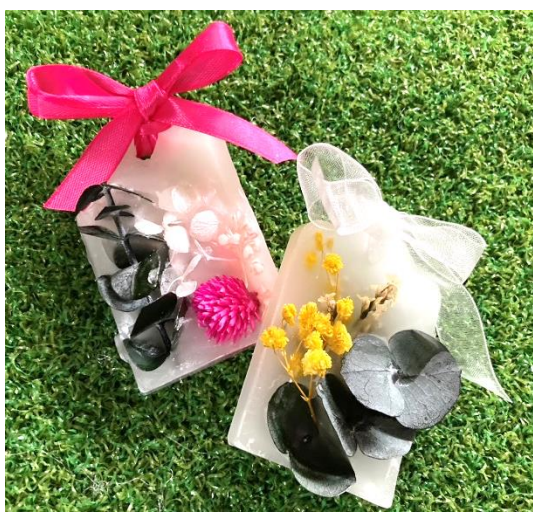
★写真は作品イメージです