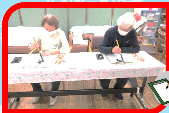
絵手紙、書道を再開いたしました♪ 参加お待ちしております♡