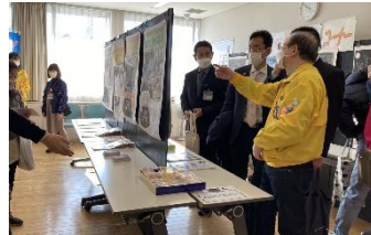
地域活動紹介と歴史の パネル展ケアプラザ協力

2月5日(日)、「踊場地区 センターまつり」が催 開催されました。“笑 顔でつなごう地域の 輪”をテーマに子ども たちの楽しい遊びや戸 塚中、汲沢中、戸塚高 の舞台発表などが行 われ