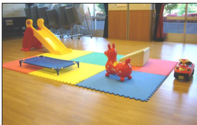
パネルマット（40枚）・乳幼児用おもちゃ